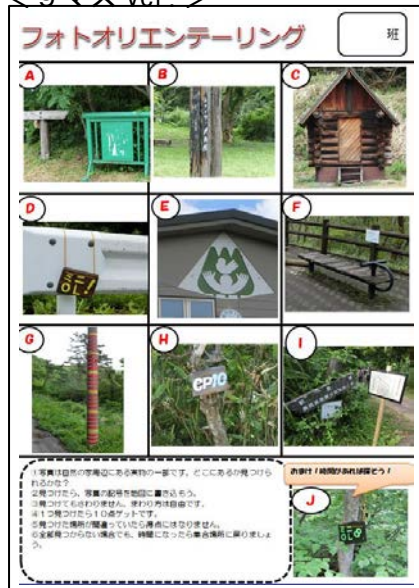
< 9マス ver >